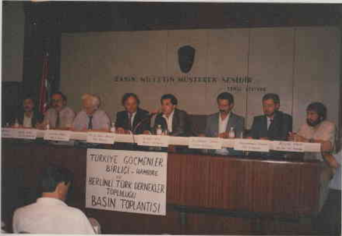
1992 Yazı / Türkiye Gazeteciler Cemiyetinde Basın Toplantısı