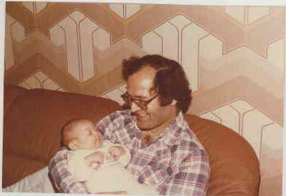
17 Haziran 1980'de babalık görevini üstlenir. Çünkü Duygu doğmuştur.