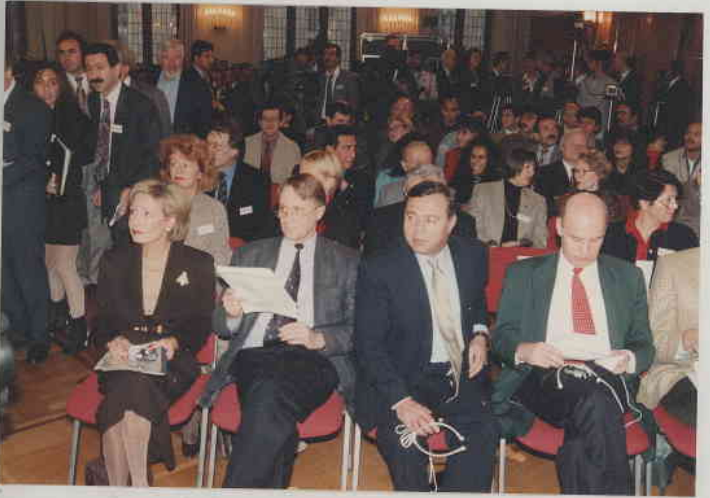
TGD Kuruluş Kurultayı - 2 Aralık 1995 - Hamburg