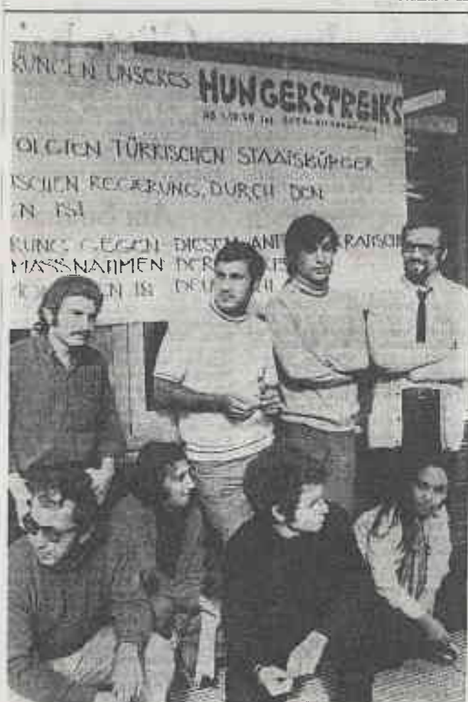
IN EINEN SOLIDARISIERUNGSSTREIK mit ihren Berliner Kommilitonen sind gestern türkische Studenten der TU getreten.