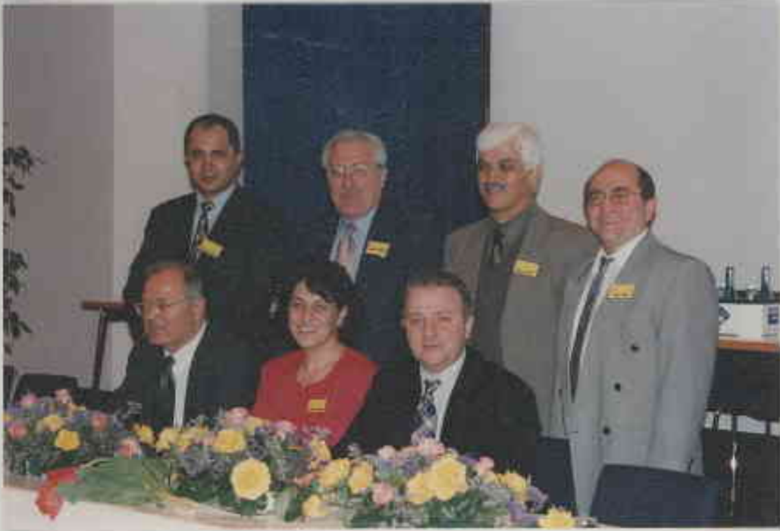
TGD 2002-2004 Yürütme Kurulu Üyeleri