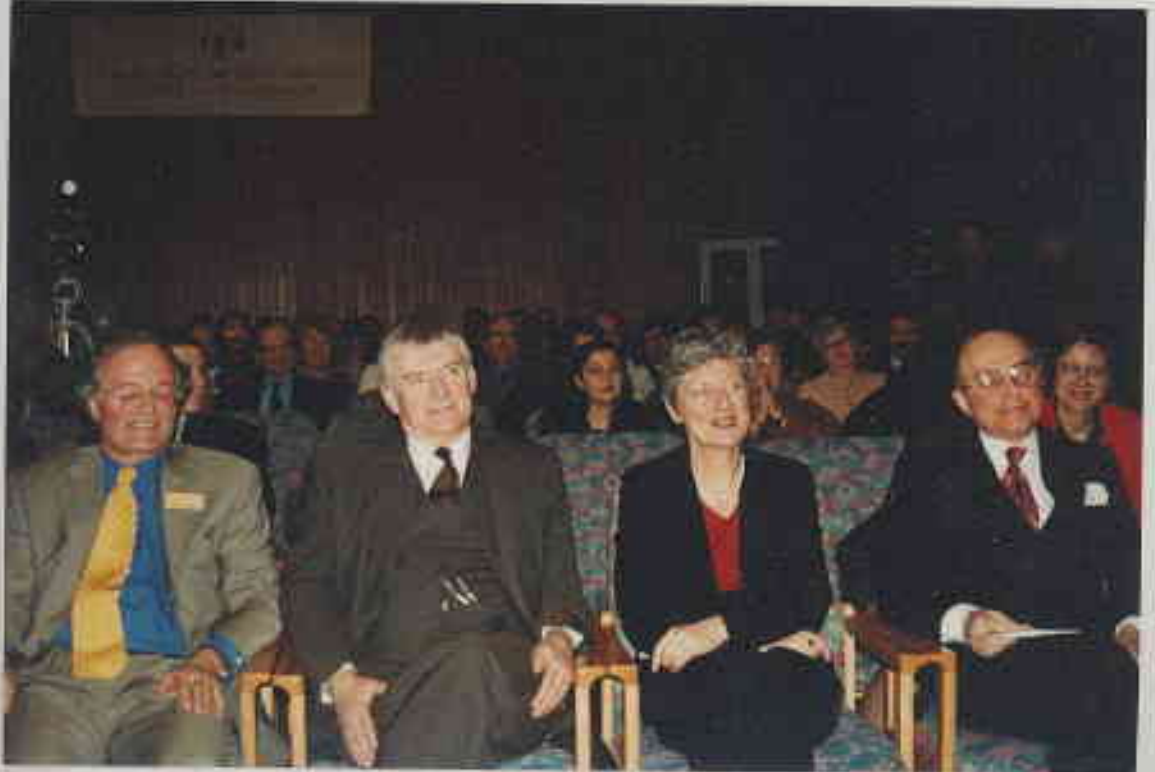
TGD Kurultayı 2000 - Hamburg/Altona Belediye Sarayı