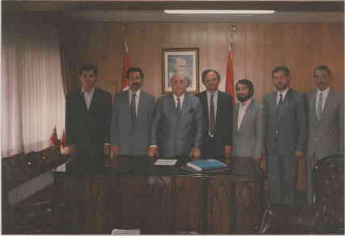
1991 Yazı - Demirel'i ziyaret