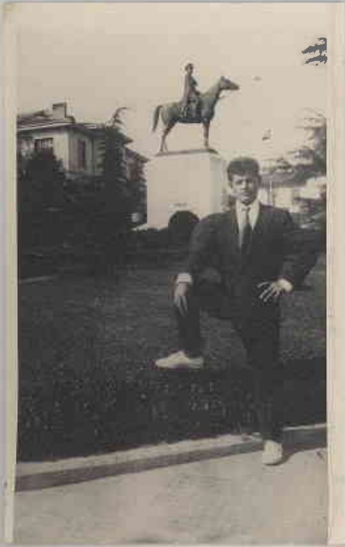
1961/1962 Ders Yılı IV. Sınıf Öğrencisi