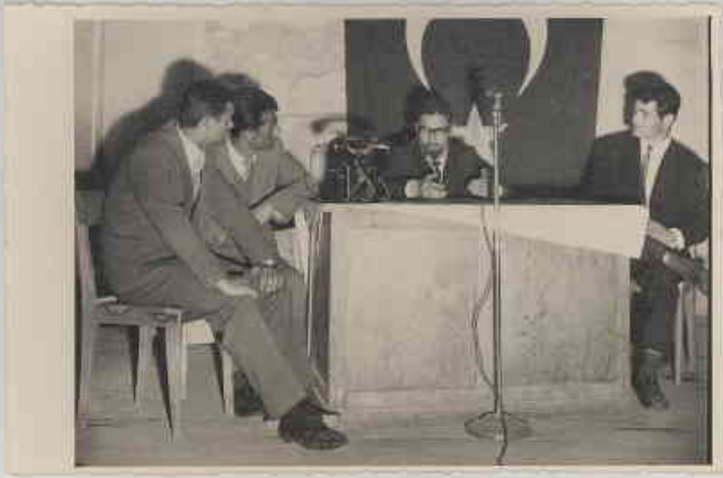
1963/1964 Ders Yılı Tiyatro Gösterisi