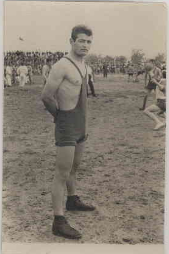
19 Mayıs 1964 Erzincan Lisesi Güreşçisi