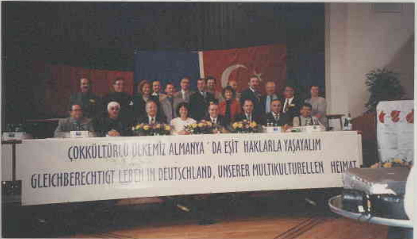
Almanya Türk Toplumunu Yönetim ve Denetim Kurulları - 29 Nisan 2002