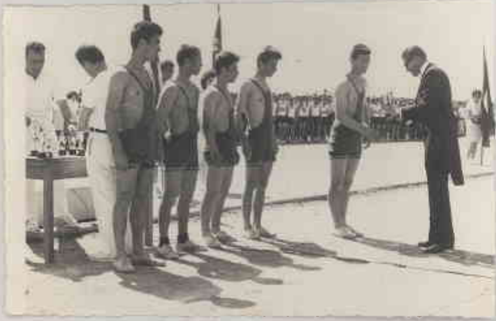
19 Mayıs 1964 Erzincan Valisi'nden takım birincilik kupası